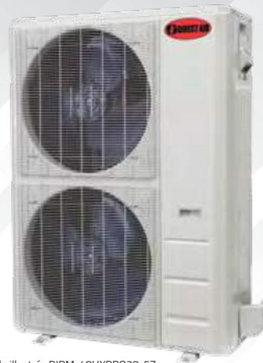
Modèle illustré : DIRM-48HXPRO28-5Z